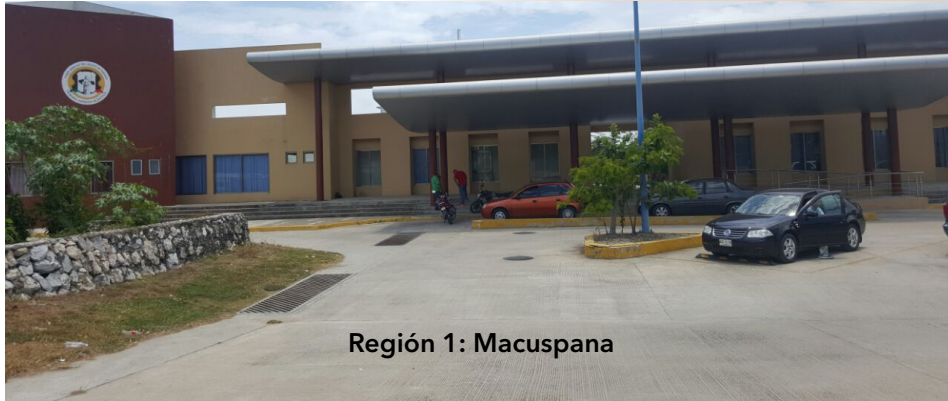
Región 1: Macuspana

Finalmente, el 6 de junio, antes del plazo constitucional previsto, logramos nuestro cometido, la implementación total del sistema acusatorio, al entrar en vigor la Región 9, con competencia en el municipio de Centro.