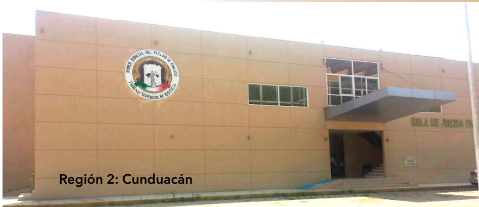
Región 2: Cunduacán