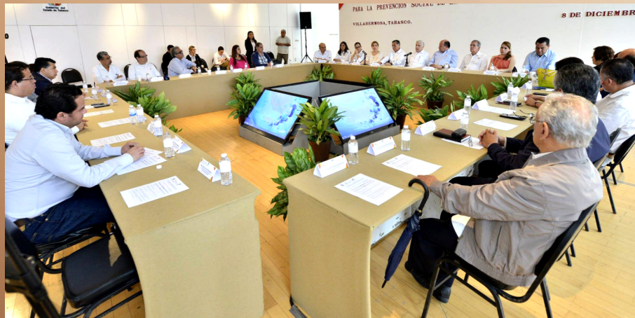
“VI Sesión Ordinaria de la Comisión Interinstitucional Estatal para la Prevención Social de la Violencia y la Delincuencia de Tabasco”, celebrada el 9 de diciembre en el Palacio de Gobierno de esta Ciudad.