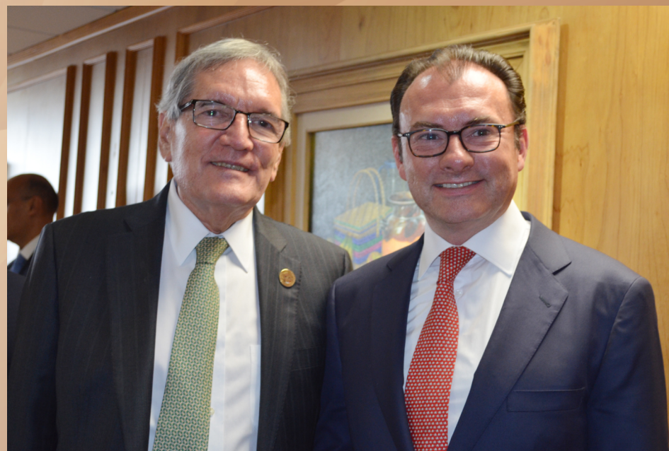
“Reunión de Concertación del Fondo de Aportaciones para la Seguridad Pública de los Estados y del Distrito Federal” (FASP) 2016, en la verificada en el mes de febrero, en México, D.F.