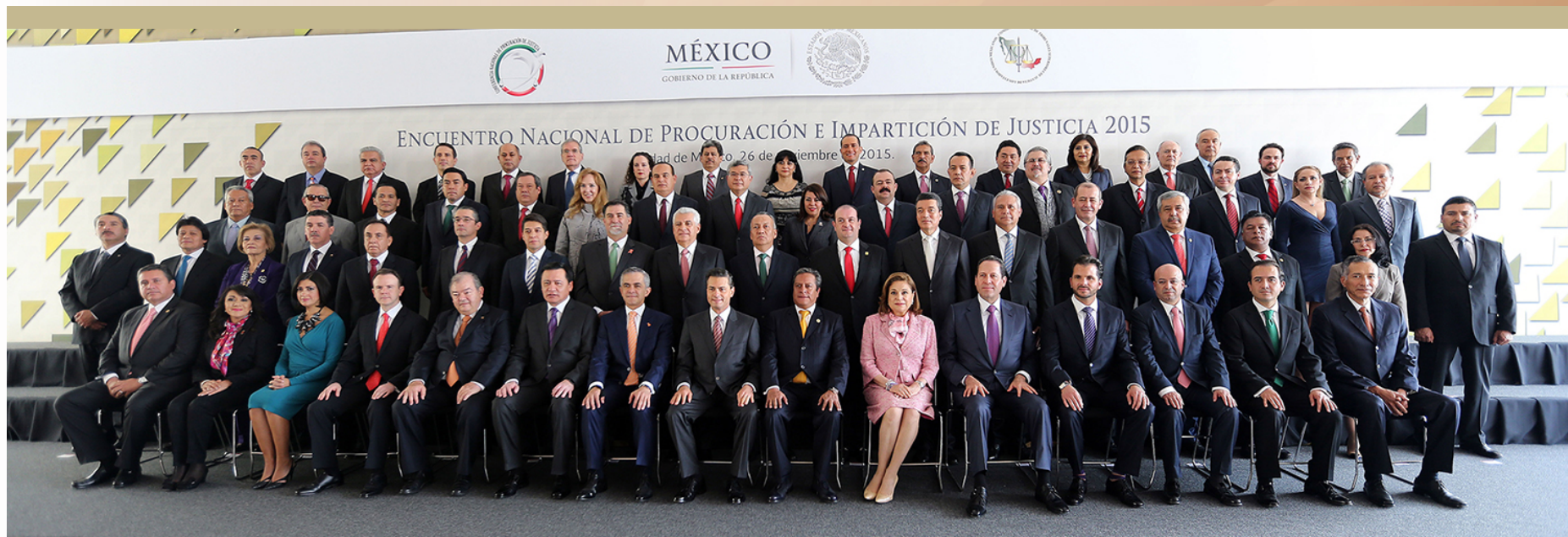
"Encuentro Nacional de Procuración y Administración de Justicia", realizado el 26 y 27 de noviembre en México, D.F.

Dentro de los eventos en que participamos destacan: