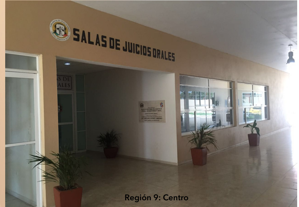
Región 9: Centro