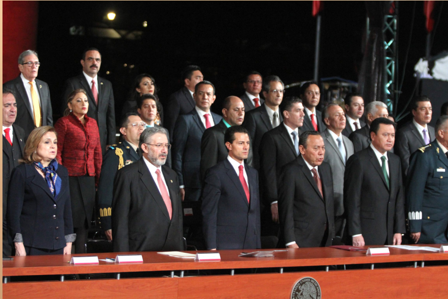
“Entrada en vigor del Nuevo Sistema de Justicia Penal Federal”, en la ciudad de México.