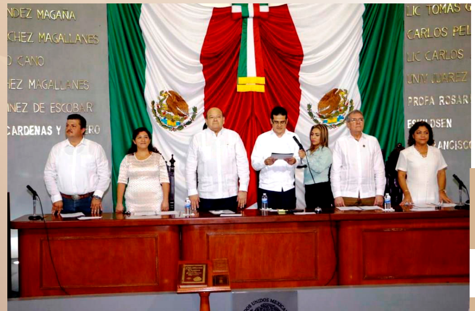
“Apertura del Primer Período Ordinario de Sesiones de la LXII Legislatura del Estado”, verificada el 1 de enero.