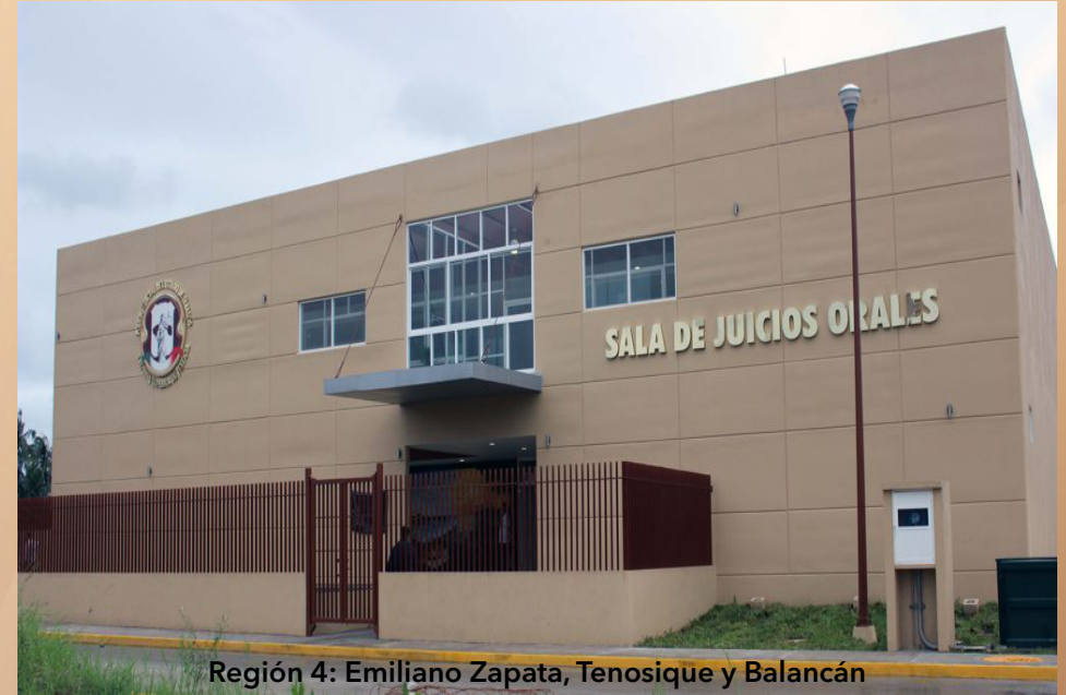
Región 4: Emiliano Zapata, Tenosique y Balancán