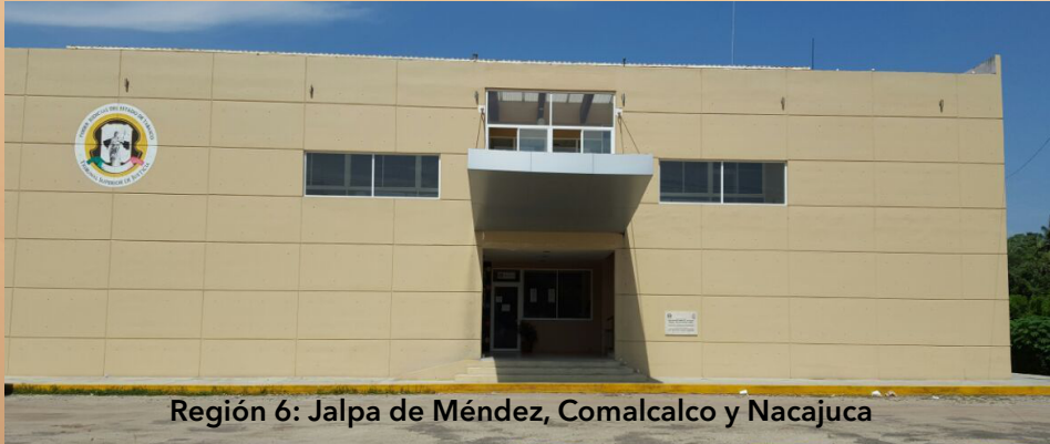
Región 6: Jalpa de Méndez, Comalcalco y Nacajuca