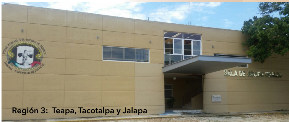
Región 3: Teapa, Tacotalpa y Jalapa