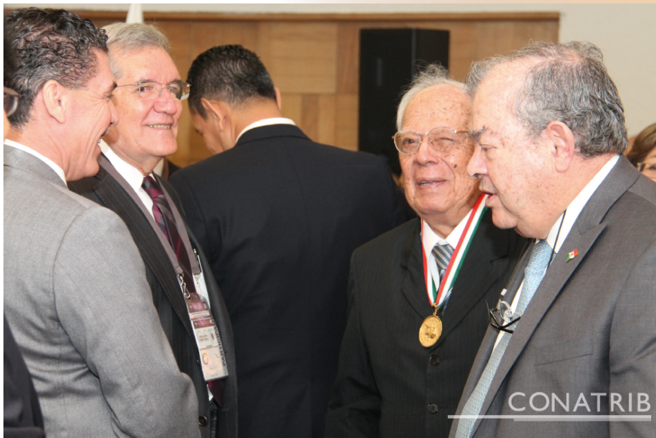
“Reunión de toma de protesta de la directiva de la Comisión Nacional de Tribunales Superiores de Justicia”, efectuada en el mes de diciembre, en la ciudad de México, D.F.