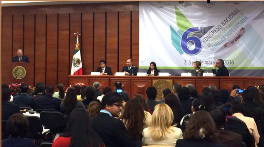
“VI Congreso Nacional de Centros de Convivencia Familiar Supervisada” celebrado en el mes de marzo en la ciudad de México.