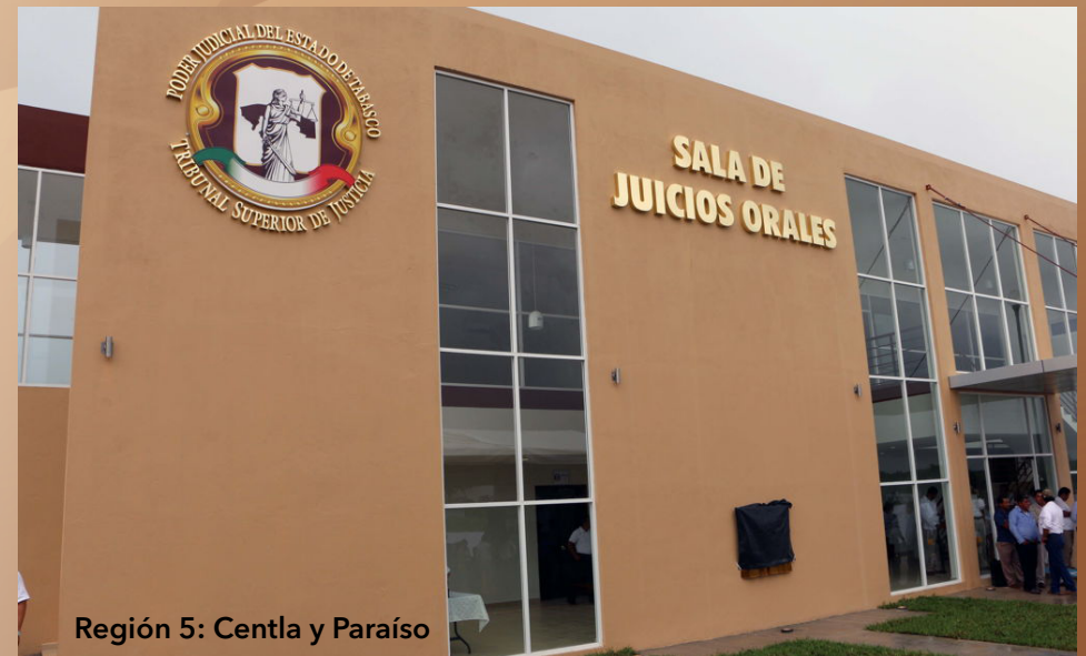
Región 5: Centla y Paraíso