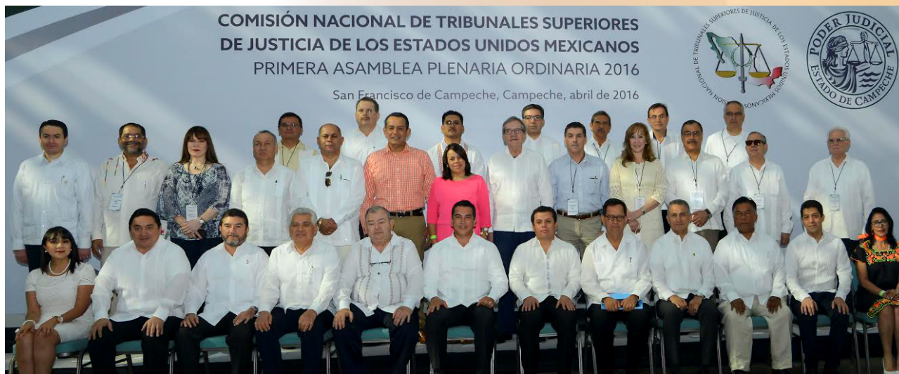
“Primera Asamblea Plenaria Ordinaria 2016, de la Comisión Nacional de Tribunales Superiores de Justicia de los Estados Unidos Mexicanos”, celebrada en el mes de abril en la ciudad de Campeche.

“Firma del Convenio entre la Universidad Pompeu Fabra, de Barcelona, España, con la Corte Interamericana de Derechos Humanos”, realizada en la ciudad de San José, Costa Rica.