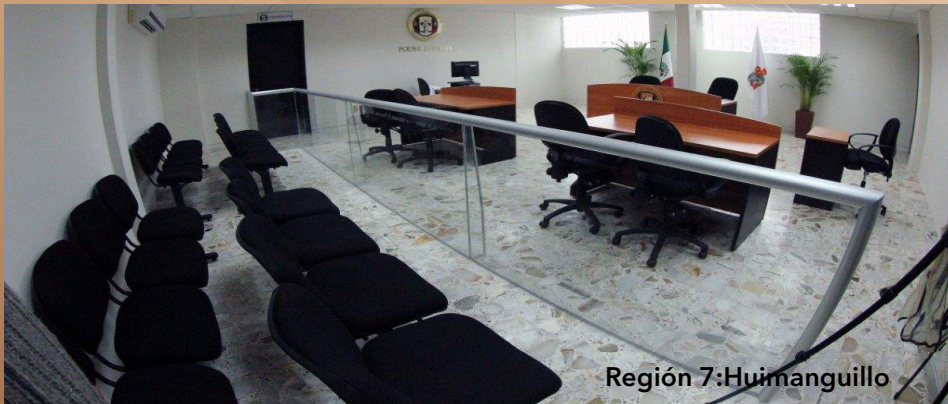
Región 7: Huimanguillo