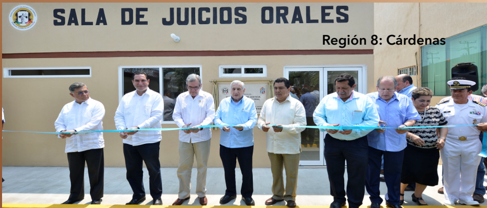
Región 8: Cárdenas