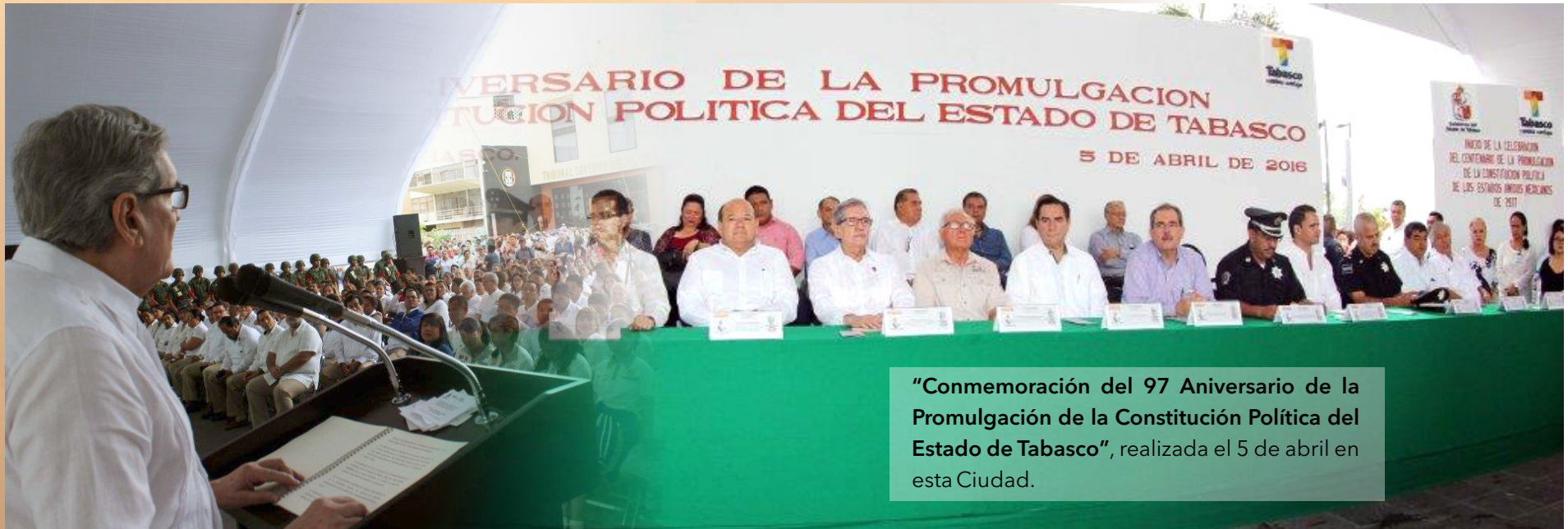
“Commemoración del 97 Aniversario de la Promulgación de la Constitución Política del Estado de Tabasco”, realizada el 5 de abril en esta Ciudad.