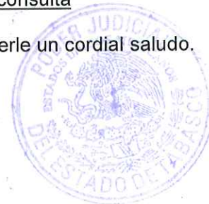
DRA. ANABELL CHUMACERO CORRAL DIRECTORA DEL CENTRO DE ESPECIALIZACIÓN JUDICIAL