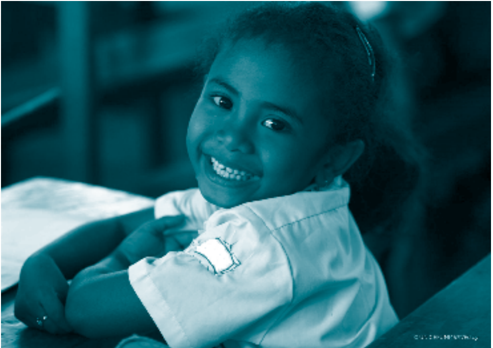
Niña sonriendo.