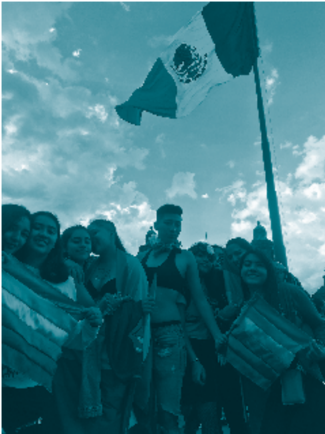
Marcha del orgullo, Ciudad de México. 2019.

Por último, se recomienda ampliamente que las sentencias se dirijan a las infancias y adolescencias tal como se autodeterminen, sobre todo cuando pertenezcan a las disidencias de género y sexuales. Esto incluye referirse tanto a los nombres elegidos —en caso de que ellos varíen de los registrados legalmente— como a los pronombres con los que se identifiquen ( ella/el/elle ).