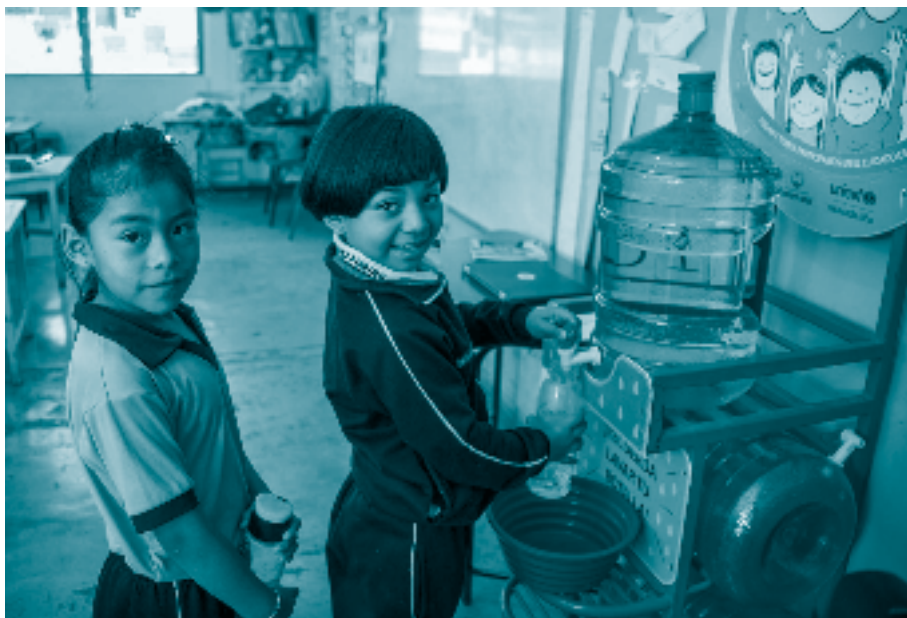
Dos niñas estudiantes de primaria.

Además, comenzó a asumirse la visión del papel de padres y madres como personas obligadas a procurarles cuidado, crianza y cubrir sus necesidades elementales. 24 Esta construcción moderna comenzó a identificar que en la infancia se presentaban otras características distintas de las adultas que necesitaban una atención especializada, lo que incluía una educación particular. 25