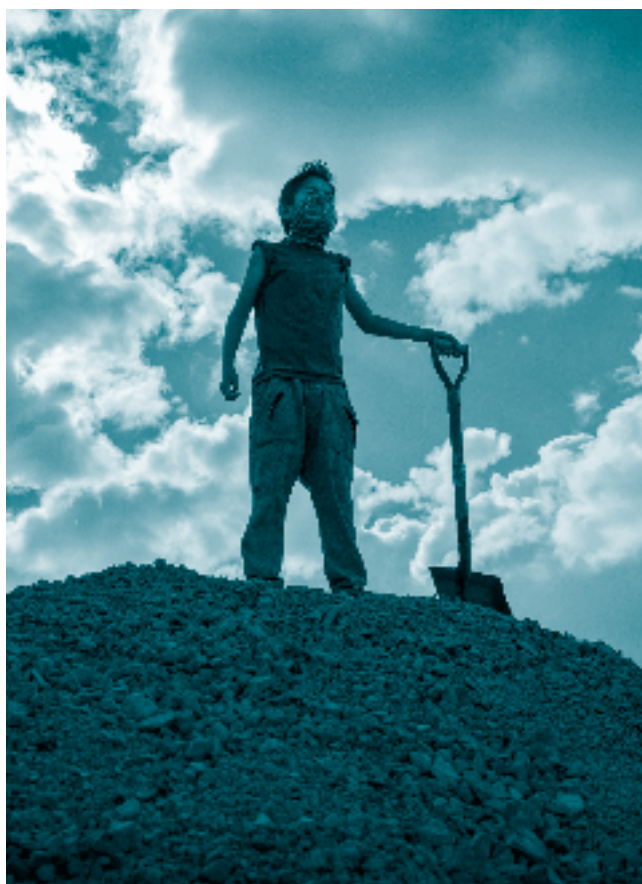
Niño que trabaja en una fábrica de ladrillos.

Éstas pueden ser su edad, sexo, género, identidad u orientación sexual, grado de madurez, experiencia, discapacidad, nacionalidad, etnia, contexto social y cultural, como la ausencia o presencia de progenitores, la convivencia con ellas o ellos, las relaciones entre la NNA y su familia o personas cuidadoras en general, el entorno en relación con su seguridad, así como la existencia de medios alternativos de calidad a disposición de la familia, la familia ampliada o personas cuidadoras, entre otros. 755