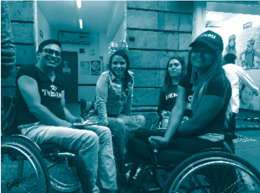
Marcha del orgullo, Ciudad de México, 2019.

La Corte IDH utilizó el concepto de interseccionalidad de la discriminación por primera vez, precisamente, en un caso que involucraba a una niña. Esto sucedió en el caso Gonzales Lluy y otros vs. Ecuador , en el que el tribunal interamericano señaló que concurrían múltiples factores de vulnerabilidad y riesgo de discriminación en forma interseccional, asociados a la condición de niña, mujer, persona en situación de pobreza y persona con VIH. 216