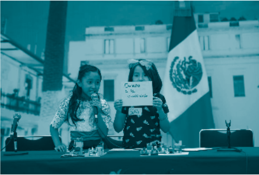
Panel Derechos de Niñas, Niños y Adolescentes. 2019. Red Nacional de Difusores Infantiles de los Derechos de Niñas, Niños y Adolescentes.

Por ende, las escuelas —públicas y privadas— 336 deben proveer las condiciones necesarias para que el derecho a la educación se ejerza en espacios integrados, seguros, libres de violencia, donde la infancia pueda desarrollar sus aptitudes y competencias y puedan aprender los valores que les permitirán convivir en sociedad. 337