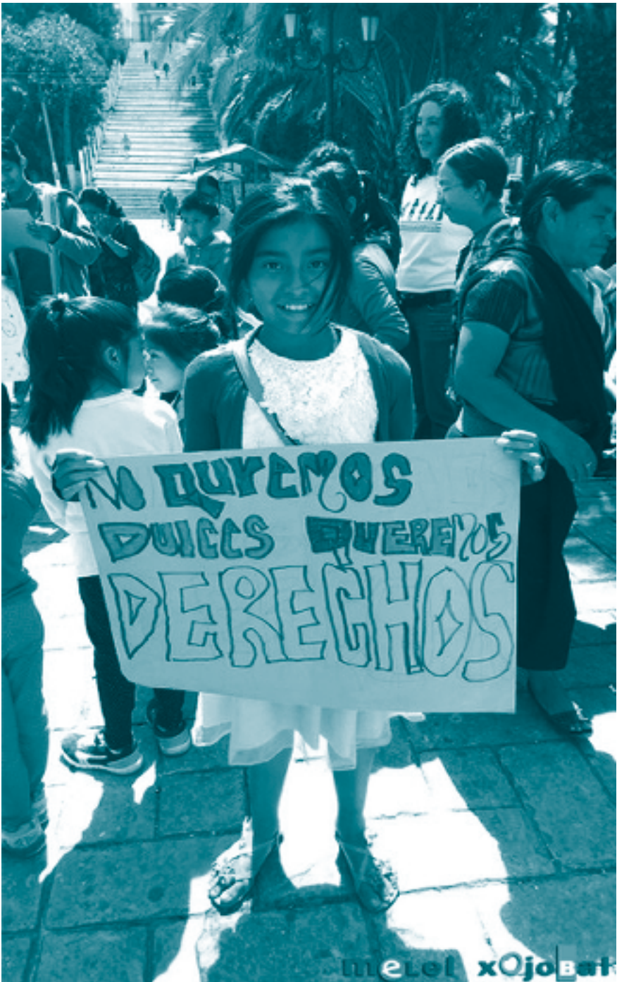
No queremos dulces, queremos derechos. 2015. Melel Xojobal A.C.