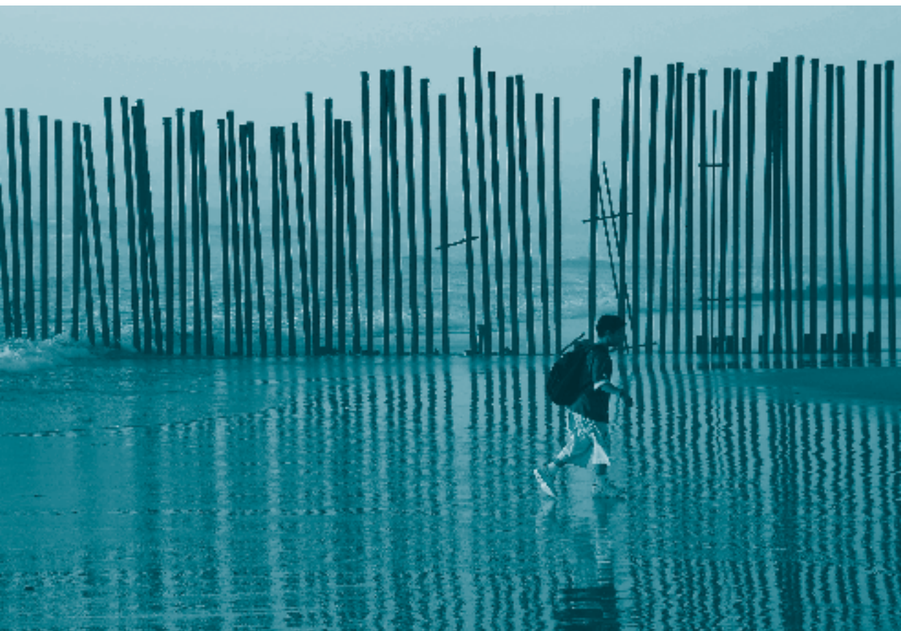
Niño caminando junto a barda fronteriza.

Sin embargo, dichas medidas siempre deben ser idóneas, razonables y proporcionales a las circunstancias de cada caso, teniendo en cuenta siempre el principio de mantenimiento del NNA en su núcleo familiar. 534 Así, la persona juzgadora podría ordenar como medida cautelar la separación de NNA del progenitor que le sustrajo o retuvo ilegalmente y ordenar su internamiento en una casa hogar para asegurarse de su localización. Sin embargo, dicha medida debe ser idónea y razonable, lo que implica aplicarla únicamente ante la inexistencia de otra alternativa de persona cuidadora, de