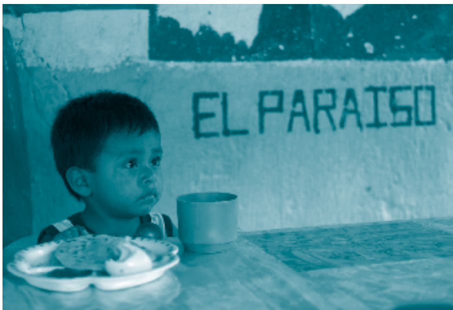
Niño en centro comunitario de Jocotán.

Estas líneas investigativas otorgan una gran relevancia a la interacción entre el papel activo que desempeñan NNA en su propio desarrollo y el entorno que les rodea, sean personas adultas u otras NNA con mayores capacidades. 86 El aprendizaje social es la manera más efectiva para lograr el desarrollo de competencias. Este aprendizaje se lleva a cabo a partir de la interacción y la participación, pues es justo mediante sus propias actividades y la comunicación que establecen con las demás personas, que NNA llegan a conocer y comprender el mundo. 87