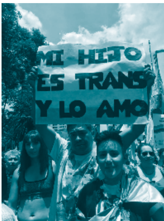
Marcha del orgullo, CDMX. 2019. Milena Pafundi. Archivo Agencia Presentes.

En este mismo sentido, la SCJN ha distinguido entre discriminación por objeto y por resultado. La primera, discriminación directa o por objeto, se refiere a aquellos casos en que la distinción, exclusión, restricción o preferencia arbitraria e injusta deriva de las normas y prácticas de manera explícita. La segunda, discriminación indirecta o por resultado, se refiere a aquellos casos en que las normas y prácticas son aparentemente neutrales, pero el resultado de su contenido o aplicación constituye un impacto desproporcionado en personas o grupos en situación de desventaja histórica, sin que para ello exista alguna justificación objetiva y razonable. 188